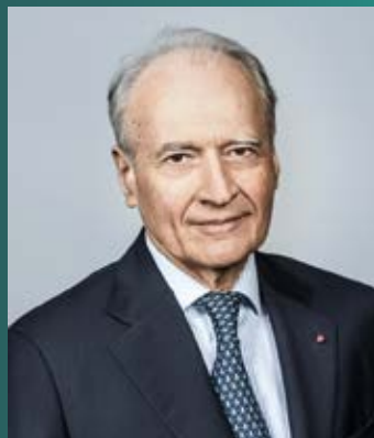
Xavier Huillard Presidente Director General

Para la edición 2020 de CASTOR INTERNATIONAL, Camerún, Estonia, Letonia, Lituania y Serbia se unen a los países beneficiarios del programa, que ya suman 40.