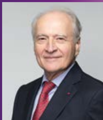
Xavier Huillard administrerende direktør

I 2022-udgaven af CASTOR INTERNATIONAL tilslutter Elfenbenskysten, Danmark, Irland og Senegal sig til modtagerlande i programmet, som nu er oppe på 45.