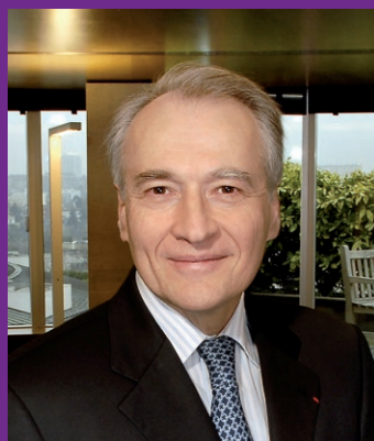
Xavier Huillard Presidente Director General

La edición 2017 de CASTOR INTERNATIONAL acoge a la República Dominicana, lo que eleva a 30 el número de países beneficiarios del programa.