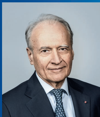
Xavier Huillard Presidente e Direttore generale

Per l'edizione 2019 di CASTOR INTERNATIONAL anche Camerun, Italia, Norvegia, Finlandia e Grecia si aggiungono ai paesi beneficiari del programma, che salgono così a 36.