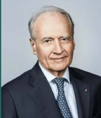
Xavier Huillard Πρόεδρος και Διευθύνων Σύμβουλος

Για την έκδοση του εντύπου CASTOR INTERNATIONAL 2020, το Καμερούν, η Εσθονία, η Λετονία, η Λιθουανία και η Σερβία προστίθενται στις χώρες που δικαιούνται να συμμετέχουν στο πρόγραμμα, οι οποίες πλέον έφθασαν τις 40.