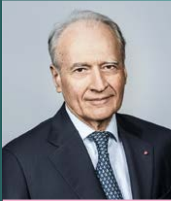
Xavier Huillard Juhtkiri

CASTOR INTERNATIONALi 2020. aasta väljalaske jaoks liituvad programmiga Kamerun, Eesti, Läti, Leedu ja Serbia, tõstes programmiga ühinenud riikide arvu 40-ni.