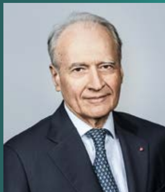
Xavier Huillard Konsernsjef

For 2020-utgaven av CASTOR INTERNATIONAL inkluderes Kamerun, Estland, Latvia, Litauen og Serbia blant landene som deltar i programmet, som med dette omfatter 40 land.