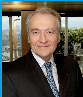
Xavier Huillard président-directeur général

Cette année encore, VINCI vous propose une nouvelle opération «CASTOR INTERNATIONAL» couvrant dorénavant 27 pays à travers le monde, dont pour la première fois, Bahreïn, le Cambodge, les Emirats Arabes Unis et la Malaisie.