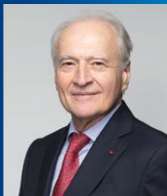
Xavier Huillard Πρόεδρος και Διευθύνων Σύμβουλος

Για την έκδοση CASTOR INTERNATIONAL 2021, η Κολομβία και η Ουγγαρία προστίθενται στις χώρες που δικαιούνται να συμμετέχουν στο πρόγραμμα, οι οποίες πλέον έφθασαν τις 41.