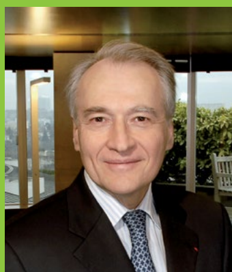
Xavier Huillard generální ředitel

V nastávajícím roce 2016 bude program CASTOR INTERNATIONAL zaveden rovněž v Mexiku a na Novém Zélandě, což zvýší celkový počet zemí, které tento program využívají na 29.