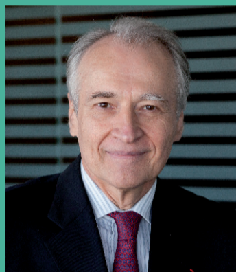
Xavier Huillard Presidente direttore generale

Grazie al crescente successo dei piani Castor circa il 10% del capitale è controllato, direttamente o indirettamente, da oltre la metà dei dipendenti della società e il fatto che i collaboratori siano il primo azionista di VINCI contribuisce alla stabilità e all'indipendenza del nostro Gruppo. Il successo della campagna 2012 e l'impegno nel promuovere il risparmio azionario dei dipendenti quale importante strumento di coesione sociale ci hanno spinto a lanciare una nuova operazione «CASTOR»