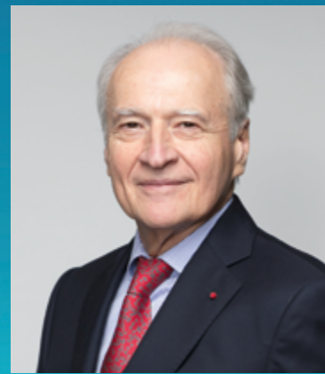
Xavier Huillard Πρόεδρος και Διευθύνων Σύμβουλος

Για την έκδοση 2023 του CASTOR INTERNATIONAL, η Σερβία προστίθεται στις 46 χώρες με δικαίωμα συμμετοχής στο πρόγραμμα.