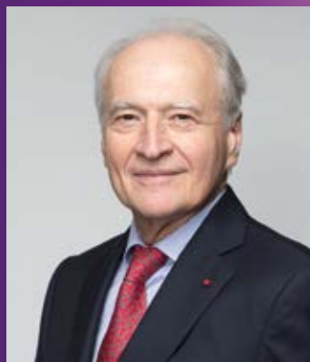
Xavier Huillard Πρόεδρος και Διευθύνων Σύμβουλος

Για την έκδοση CASTOR INTERNATIONAL 2022, η Ακτή Ελεφαντοστού, η Δανία, η Ιρλανδία και η Σενεγάλη προστίθενται στις χώρες που δικαιούνται να συμμετέχουν στο πρόγραμμα, οι οποίες πλέον έφθασαν τις 45.