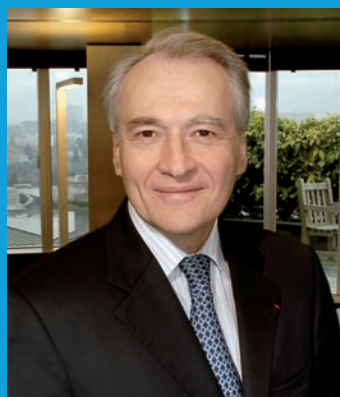
Xavier Huillard pengerusi & ketua pegawai eksekutif

Sekali lagi untuk tahun ini, VINCI menawarkan skim simpanan «CASTOR INTERNATIONAL» di 27 buah negara di seluruh dunia, termasuk Bahrain, Cambodia, Malaysia, dan United Arab Emirates buat pertama kali.