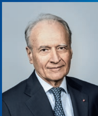
Xavier Huillard Πρόεδρος και Διευθύνων Σύμβουλος

Στην έκδοση του εντύπου CASTOR INTERNATIONAL 2019, το Καμερούν, η Ιταλία, η Νορβηγία, η Φινλανδία και η Ελλάδα προστίθενται στις χώρες που δικαιούνται να συμμετέχουν στο πρόγραμμα, που πλέον γίνονται 36.