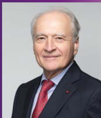
Xavier Huillard CEO

Voor de editie 2022 van CASTOR INTERNATIONAL, behoren de Ivoorkust, Denemarken, Ierland en Senegal nu ook tot de landen die deelnemen aan het programma, waarvan het aantal inmiddels staat op 45.