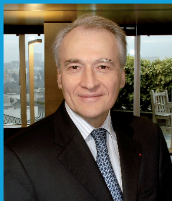
Xavier Huillard Präsident und geschäftsführender Generaldirektor

Auch in diesem Jahr bietet VINCI die Teilnahme an einem neuen internationalen Konzernspar- und Mitarbeiterbeteiligungsplan „CASTOR INTERNATIONAL“, der den Mitarbeitern in nunmehr 27 Ländern weltweit offen steht, darunter erstmals auch Bahrein, Kambodscha, Malaysia und Vereinigte Arabische Emirate.