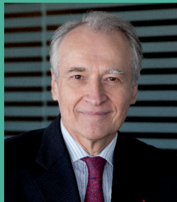
Xavier Huillard Chairman & CEO

Dank des wachsenden Erfolges der Castor-Pläne halten mehr als die Hälfte der Mitarbeiter von VINCI inzwischen direkt oder indirekt insgesamt rund 10 % des Aktienkapitals. Die Mitarbeiter sind insgesamt der größte Anteilseigner von VINCI und tragen damit zur Stabilität und Unabhängigkeit des Konzerns bei. Vermögensbildende Maßnahmen für unsere Mitarbeiter haben bei uns einen hohen Stellenwert, denn wir sind der Ansicht, dass diese das Zugehörigkeitsgefühl zum Konzern stärken. Nach dem Erfolg der Kampagne im Jahr 2012 bietet VINCI jetzt ein neues