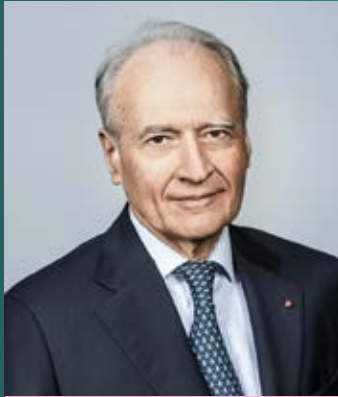
Xavier Huillard CEO

Voor de editie 2020 van CASTOR INTERNATIONAL behoren Kameroen, Estland, Letland, Litouwen en Servië nu ook tot de landen die deelnemen aan het programma, waarvan het aantal inmiddels staat op 40.